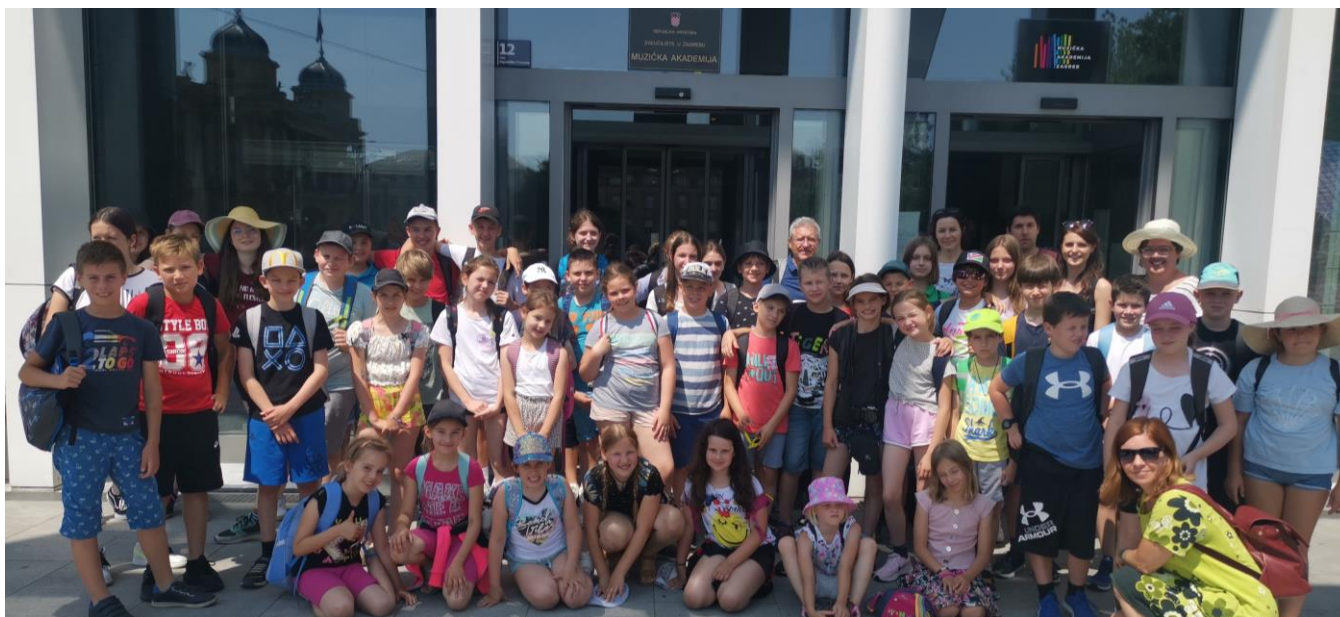
GMU 2023 – "Z glasbo in motivacijo do uspeha" - Izlet učencev obiskovalcev šolskega glasbenega abonma in učencev tekmovalcev v Zagreb (20.6.2023)

Učence, ki so pridno obiskovali abonmajске koncerte skozi šolsko leto in učence, ki so tekmovali na glasbenih tekmovanjih, smo ob zaključku šolskega leta nagradili z izletom v Zagreb. Ogljedali smo si Akademijo za glasbo, aktivno sodelovali v sobi pobega na prostem, ter obiskali živalski vrt.