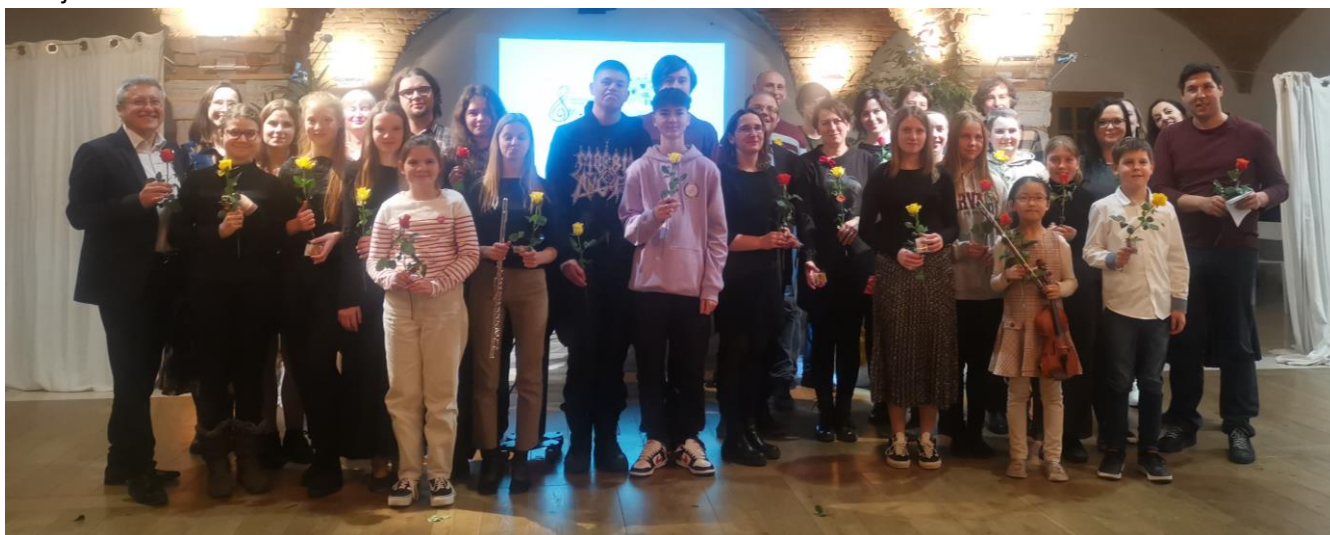
NASTOP UČENCEV WALDORFSKE GLASBENE ŠOLE IN GŠ LJUTOMER, (dvorana Waldorfske glasbene šole v Ljubljani, 24.2.2023)