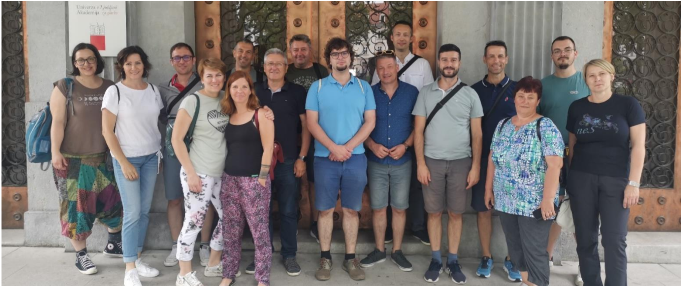
STROKOVNA EKSKURZIJA KOLEKTIVA V LJUBLJANO ( 27.6.2023) Kolektiv GŠ Slavka Osterca Ljutomer

S kolektivom GŠ Ljutomer, smo 27. 6. 2023 obiskali Ljubljano in spoznali novo Akademijo za glasbo, ki se nahaja v prenovljeni Kazini. Po ogledu akademije smo se sprehodili po ljubljanskih kulturnih znamenitostih v starem delu mesta in se z vzpenjačo povzpeli na Ljubljanski grad. Na zaključku ekskurzije smo si ogledali tudi goslarsko delavnico Demšar, kjer nam je lastnik predstavil in opisal postopek izdelave godal.