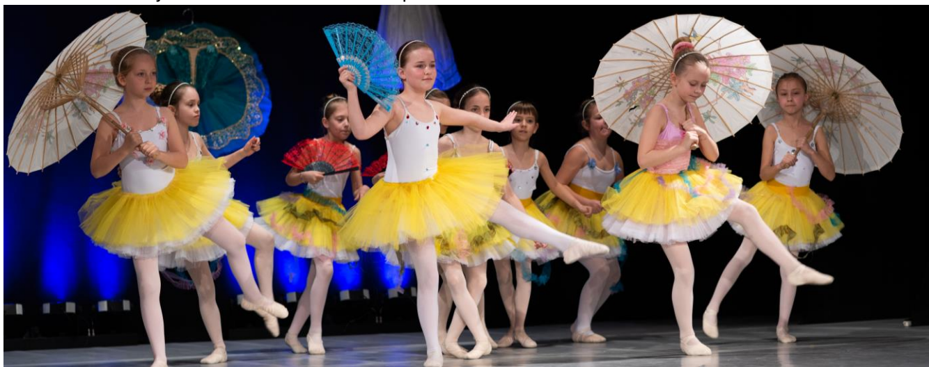
Baletna produkcija »Sanje o poletni noči« (Dom kulture Ljutomer, 31. 3. in 1.4.2023) Mentorstvo in koreografija: Štefan Ion Banica

Baletni oddelek Glasbene šole Slavka Osterca Ljutomer se je v Domu kulture Ljutomer 31.3. in 1.4.2023 predstavil občinstvu v baletni produkciji z naslovom »Sanje o poletni noči«. Na nastopu so sodelovale vse učenke plesne pripravnice in baleta pod mentorstvom in koreografijo Štefan Ion Banica. Čestitke učenkam baletnega oddelka in mentorju za odlično izvedbo baletne predstave.